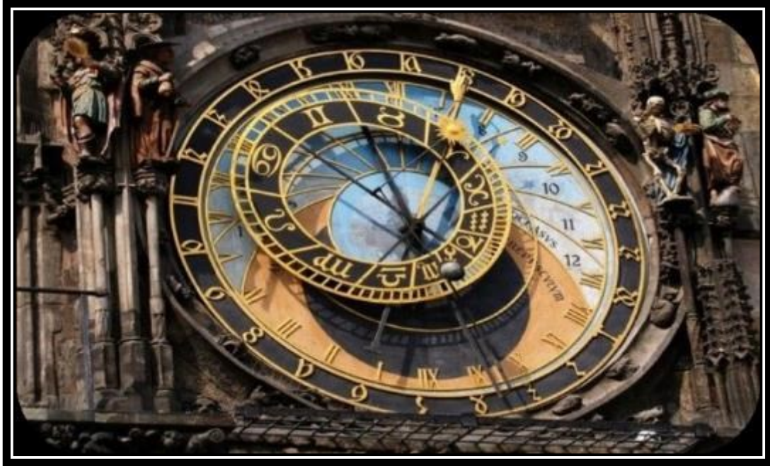
Το Αστρονομικό Ρολόι